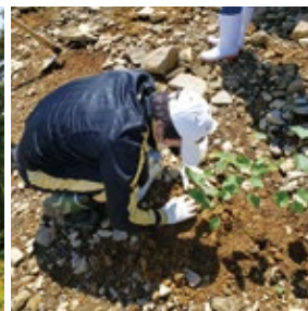
赤面山植樹活動(福島県主催)